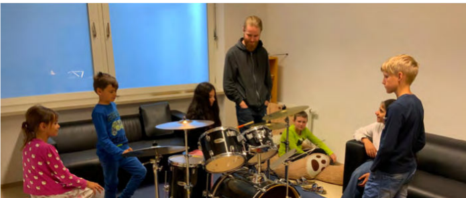
Laute & leise Töne gab's beim Besuch des Musikvereins

Am 15. Juni 2023 trafen sich die Schulanfänger:innen und die Kinder der 3. Klasse erneut in der Schule zur Vorlesezeit. Eifrig bereiteten die Schulkinder Geschichten vor. So lernten die Schulanfänger:innen den Vormittag in der Schule zusammen mit den Bremer Stadtmusikanten, dem acht-samen Tiger und der kleinen Schusselhexe gleich noch etwas besser kennen. Beim anschließenden Basteln und Zeichnen gab es noch Gelegenheit, Freundschaften zu schließen und sich auszutauschen. ●