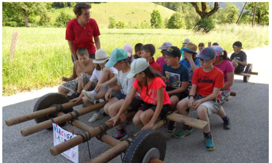
Das Flintstone-Auto wurde auf Fahrtauglichkeit getestet.

Sie lernten nicht nur Spital am Pyhrn näher kennen, sondern erfuhren auch eine Menge Interessantes über die Wasserkraft und den Wasserkreislauf. Die Kraft des Wassers konnten sie am selbstgebauten Wasserrad in einem Bachbett testen. Am zweiten Tag gingen sie gemeinsam durch die Dr. Vogelgesang-Klamm. Bei der Bosruckhütte erforschten sie mit Käfersauger und Becherlupe die Tierwelt in Wiese und Wald. Höhepunkt war der Bau eines Flintstone-Autos aus Holzstangen, Rädern und Seilen, das dann auf seine Fahr-