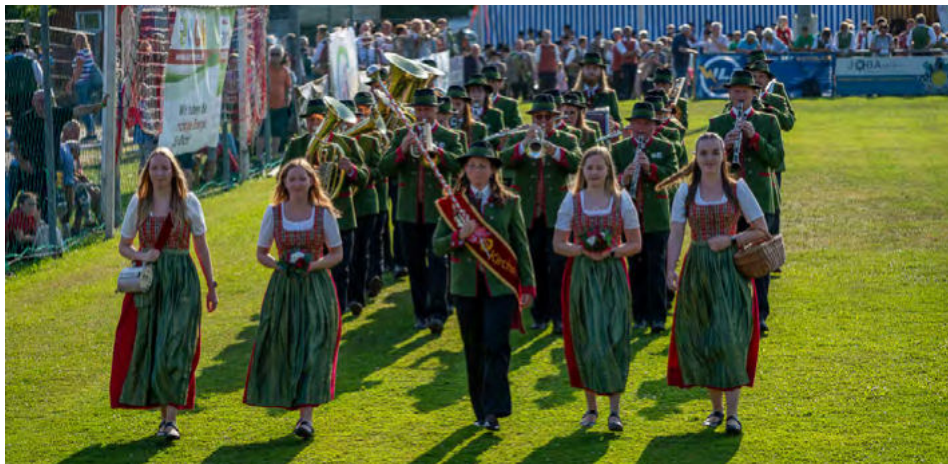
Die Musikkapelle Kirchschiag bei ihrem Auftritt.