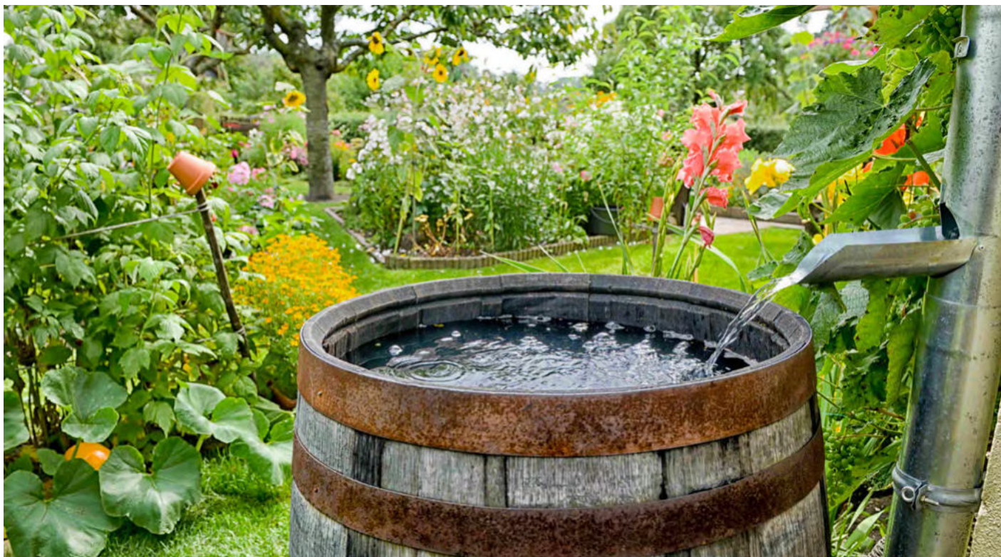
Regentonne im Garten