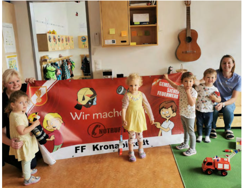
Bericht: Rosemarie Kaiser

ist dafür bestens geschult. Im Freien konnten die Kinder die