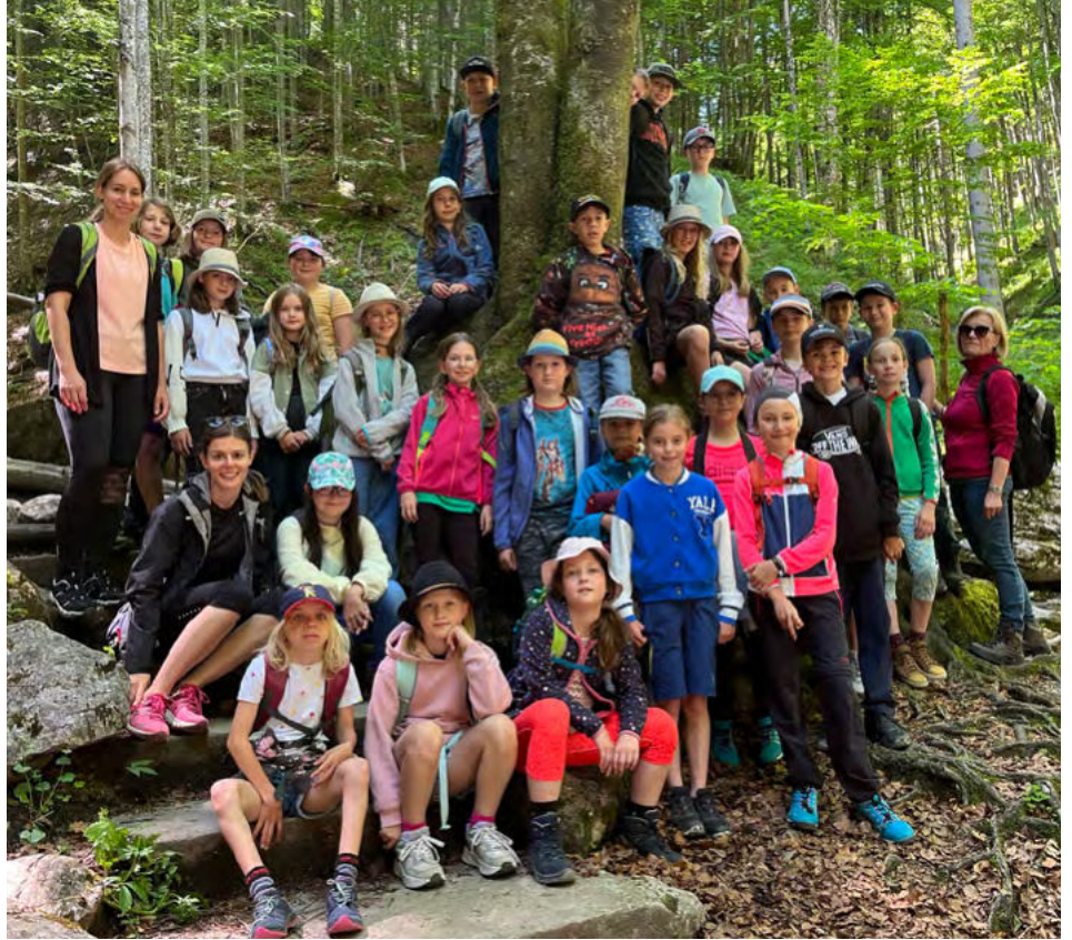
Die 4. Klasse bei den Projekttagen

Drei erlebnisreiche Tage verbrachten die Schülerinnen und Schüler der beiden 4. Klassen mit ihren drei Lehrerinnen in Spital am Pyhrn.