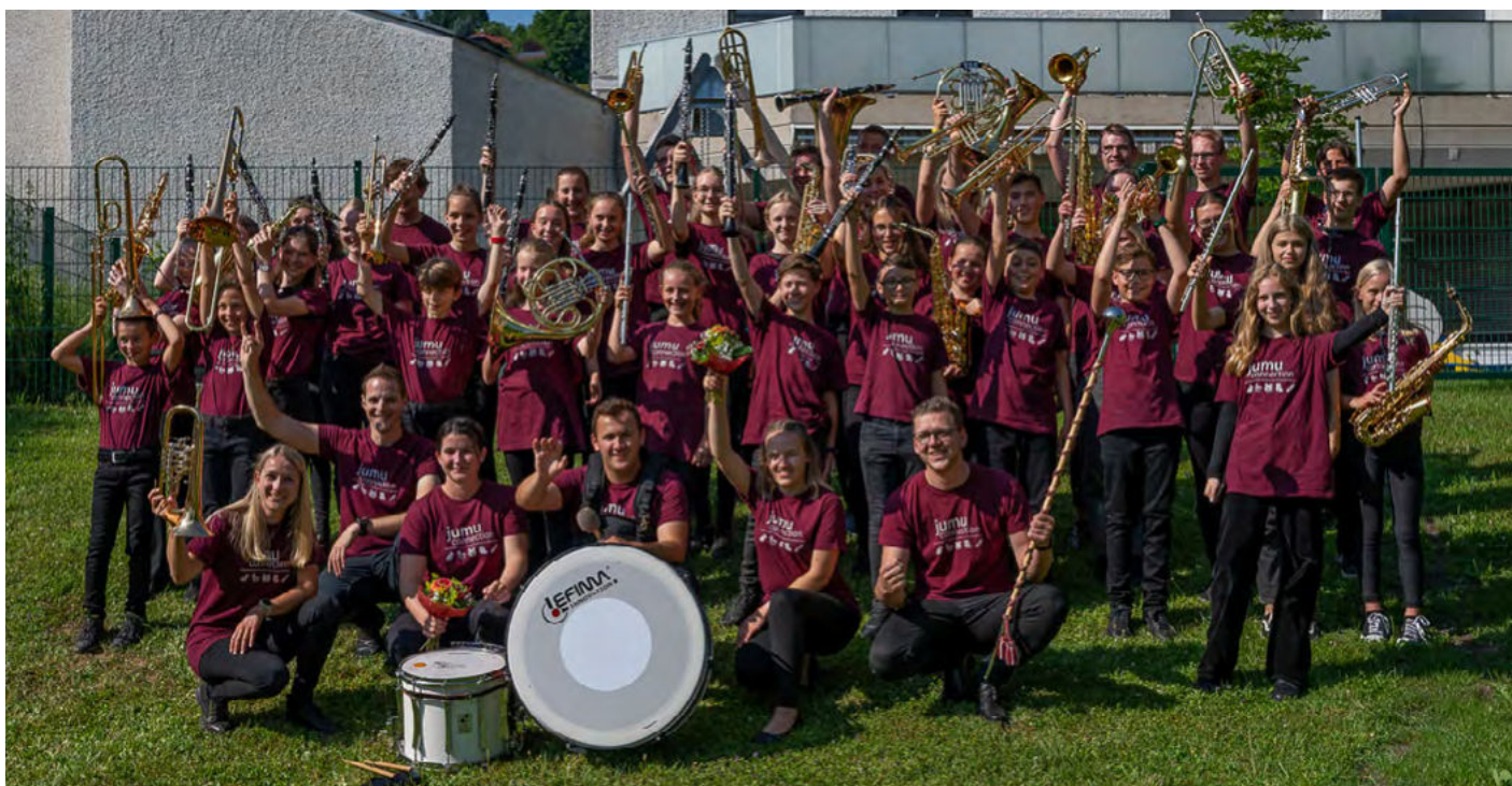
Gratulation der erfolgreichen JUMU-Connection!