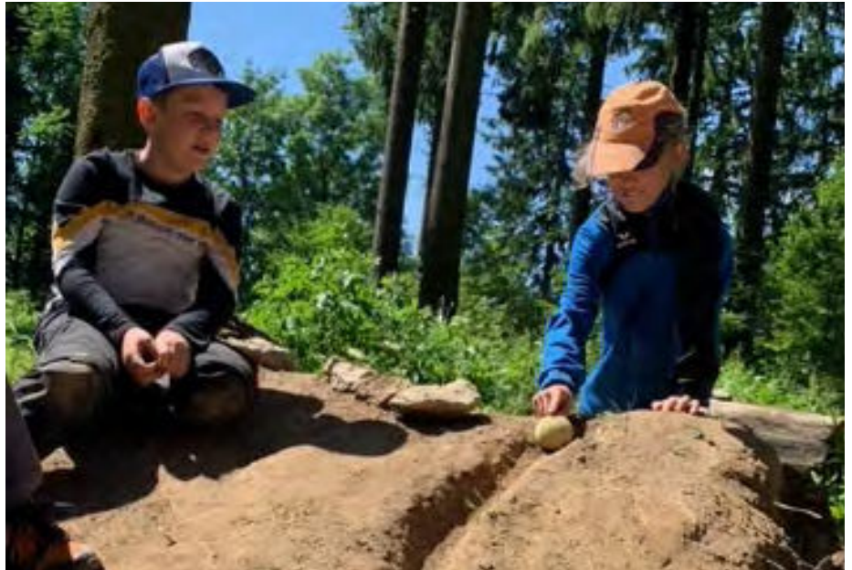
„Zuerst bauen, dann spielen“ war die Aufgabe in einer besonderen Werkstunde

Durch das Engagement der Kinder entstanden tolle Bahnen, welche die Kugeln bis zu 40 Fußlängen weit beförderten. Ein zusätzliches Highlight war der Fund von Mäusebabys, die wir gemeinsam wieder gut behütet versteckten. ●