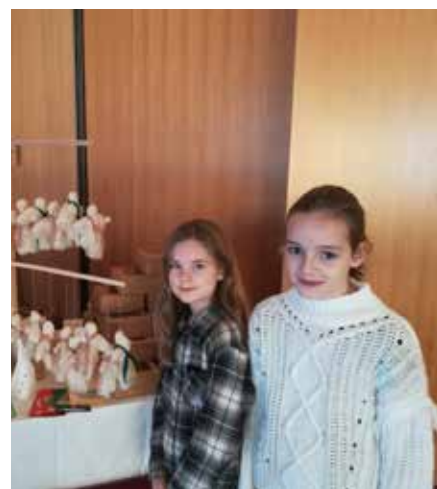
Verkaufsstand mit weihnachtlichen Bastelarbeiten,

Bildnerisches als auch plastisches Gestalten kommt neben dem Kompetenzerwerb in Deutsch und Mathematik natürlich nicht zu kurz. Seit Schulbeginn wurden in den entsprechenden Fächern Arbeiten in unterschiedlichen Werktechniken erstellt. Hier eine kleine Auswahl, die in den Klassen als auch im Schulhaus ausgestellt sind. ●