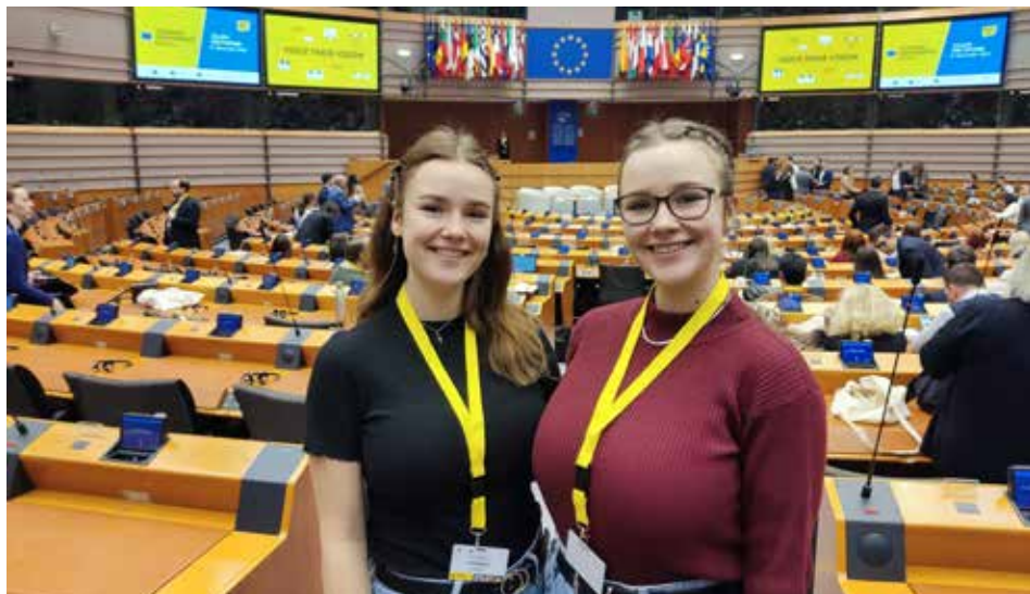
Bericht und Bild © Leonie und Clara Prammer im EU-Parlament