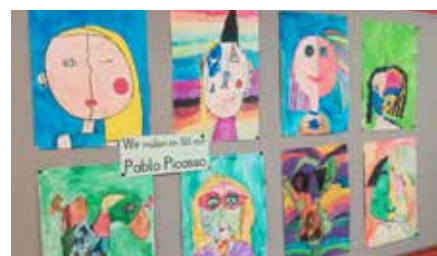
Winterbäume aus Luftmaschenschnur, Schildkröte aus Filz, Malen im Stil von Picasso

Beim adventlichen Pfarrkaffee am 1. Adventssonntag sangen viele Schülerinnen und Schüler der beiden 4. Klassen beim Projektchor mit.