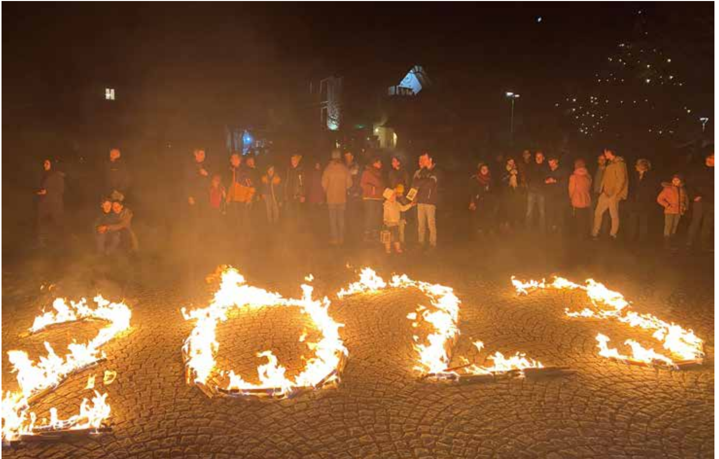
Bericht: Nina Mitterlehner