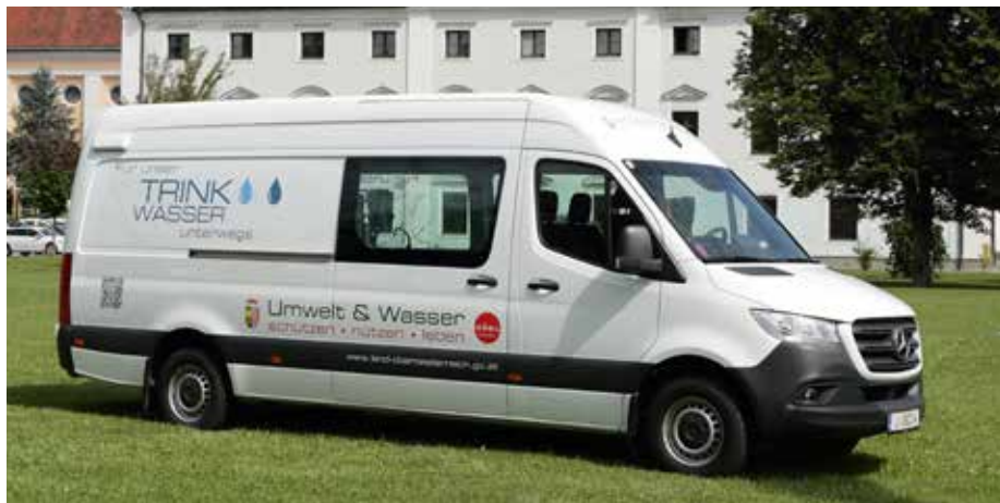
Bericht: AW Rosemarie Kaiser