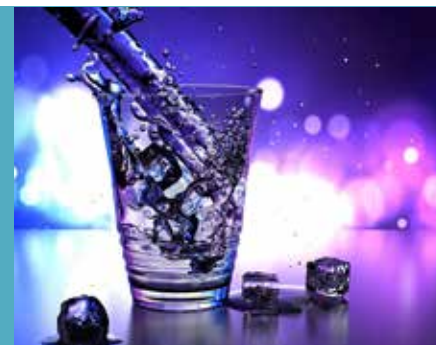
Bericht: Rosemarie Kaiser

Weitere Informationen finden Sie auch auf der Homepage des Landes Oberösterreich: www.land-oberoesterreich.gv.at