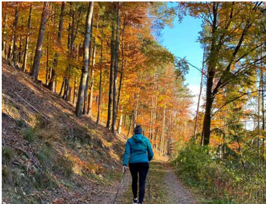
Bericht: Gesundes Oberösterreich

10.000 Schritte am Tag – eine einfache Regel, um fit zu bleiben. Auto, Fahrstuhl, Rolltreppe oder Homeoffice, all das trägt dazu bei, dass unser Körper immer weniger in Bewegung ist.