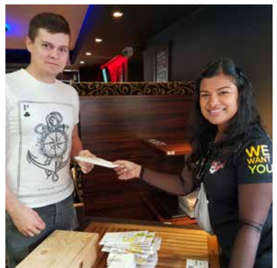
© Geben für Leben Leukämiehilfe Österreich