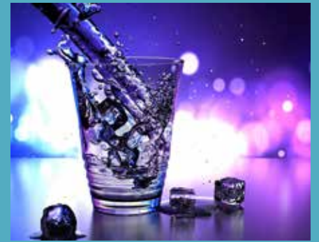
Bericht: Rosemarie Kaiser