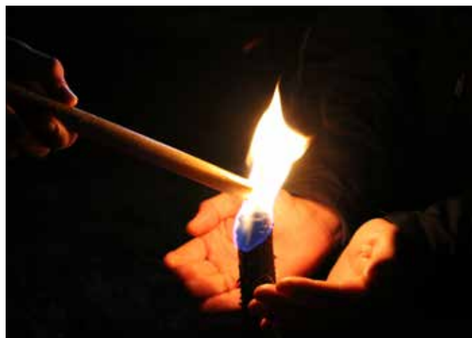
Bericht und Bild © Magdalena Froschauer-Schwarz

Bitte vormerken: Das erste Treffen für die Firmlinge: Di, 17. Jänner, 18.30 bis 20 Uhr, im St. Anna Pfarrzentrum. (In den ersten 20 Minuten gibt es Informationen für die Eltern). ●