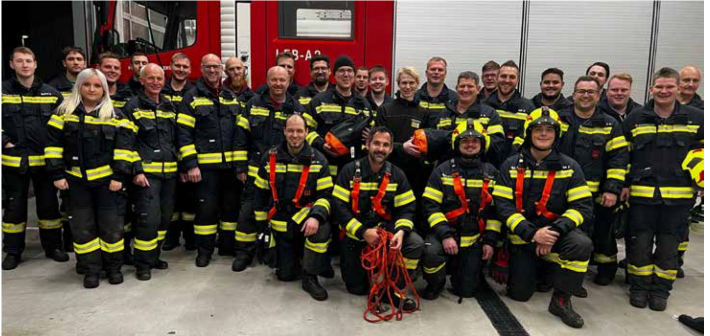
Bericht: AW Rosemarie Kaiser