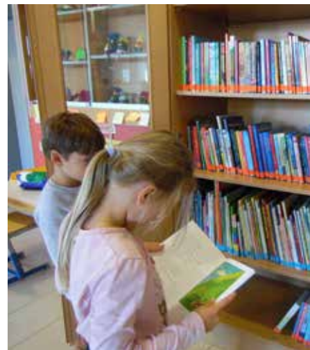
Bericht: Cornelia Pirker, Klassenlehrerin, Bilder © Birgit Gaisbauer