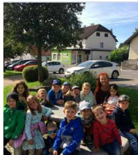
Bericht: Sigrid Lienhardt, Birgit Gaisbauer