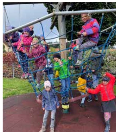
Bericht: Lisa Kaineder