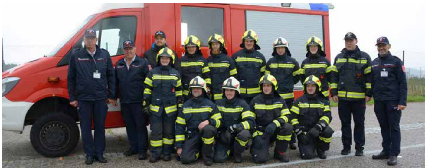
Bericht: AW Rosemarie Kaiser