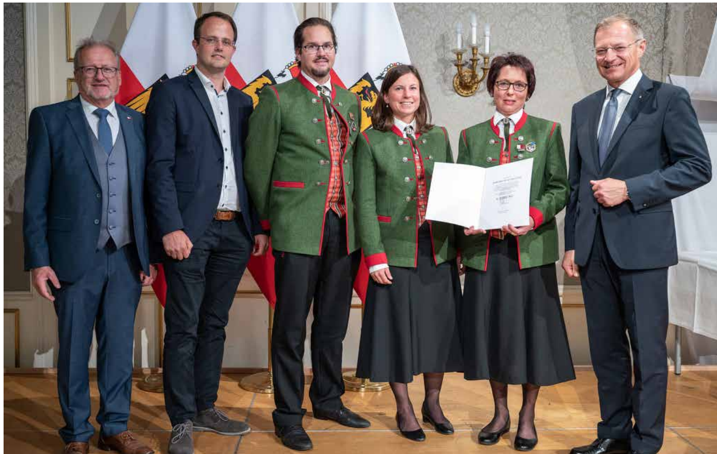
v.l.n.re.: Kons. Ing. Alfred Lugstein Präsident OÖBV, Bgm. Michael Mair BSc., Kapellmeister Ing. Christian Kaiser, Stabführerin Mag. Sabrina Azesberger, Obfrau Roswitha Gattringer, Landeshauptmann Mag. Thomas Stelzer, Bericht: Julia Reiter