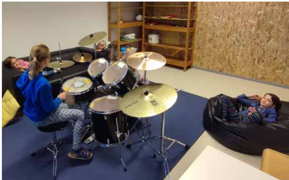
Bericht: Sigrid Prammer

Die Nachmittagsbetreuung wurde von den Kindern im Sturm erobert. Noch vor wenigen Wochen herrschte hier Baustellenstimmung, rechtzeitig zu Schulbeginn wurde alles fertiggestellt.