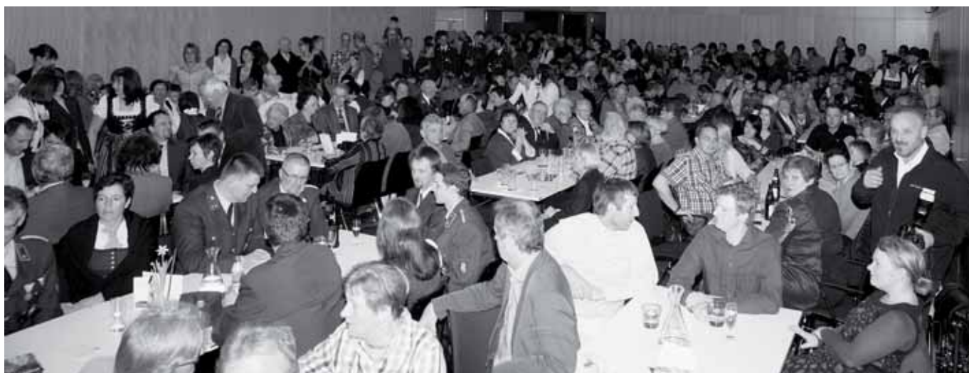
Gemeindetag, 29. März 2014